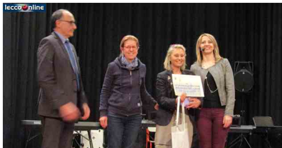
La Lega Navale di Mandello